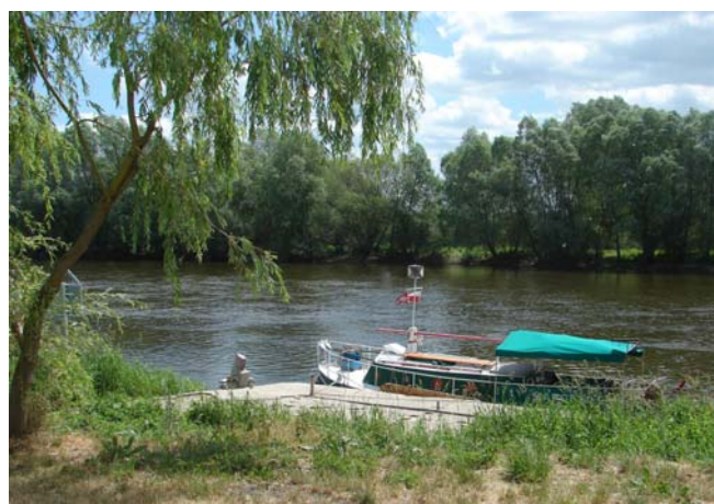
Het water in de Warta is een zwaardbreedte gevallen (lager geworden)