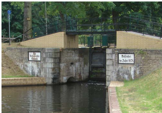
De Leesenbruckerluis in het Finowkanaal. Alleen te gebruiken als het 24 uur van te voren is aangevraagd..