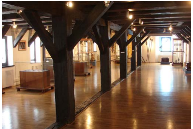
Bydgoszcz. Het historisch museum.

Op ons gemak even wat gedronken en een boterham verorberd, daarna de fietsen op de wal getild en op de fiets de stad in. Het museum nog eens bekeken.