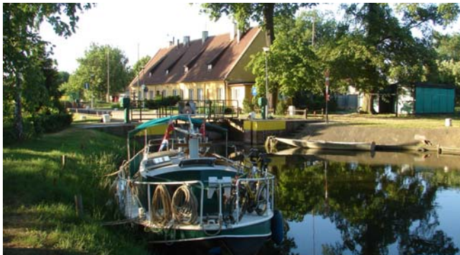
Labiszyn. Ingericht als ligplaats!

Marina's, maar hier in Labiszyn hebben ze het begrepen: er staan paaltjes op de kant om aan te leggen, het is op afgesloten terrein (dus veilig), je kunt water tappen en er is sanitair. Bovendien een plaats waar je boodschappen kunt doen. Dus gewoon alles wat je nodig kunt hebben.