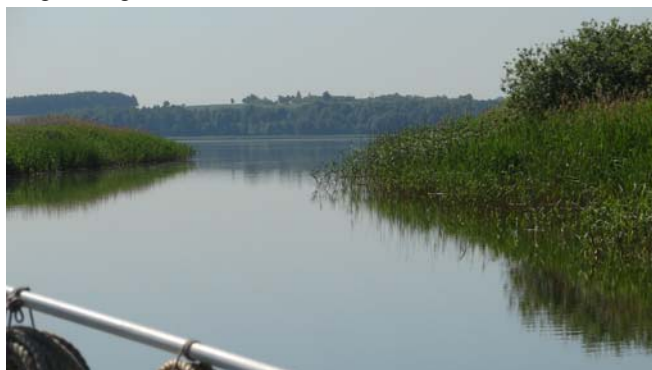
We naderen het meertje (Jez.) Wolickie.

Tegen 9 uur even wat rustiger gevaren, er lag een boom in het water en erbij zat een hoop riet, we konden het niet goed bekijken. Gelukkig bleek het riet drijvend te zijn, we konden er zonder bezwaar langs. We vroegen ons wel even af of dat laatste schip wat in het boekje van de sluiswachter stond (een barkas uit Hamburg) misschien hier vorig jaar langs was gekomen.