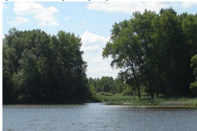
De ingang van het Slezinsky kanaal.

er is veel diep water, er zijn prachtige ankerplekjes en de vaargeul naar Konin is betond. Weliswaar zijn ze af en toe erg zuinig met de tonnen, maar als je (soms met behulp van de kijker) de tonnen volgt is er niets aan de hand. Op de wal erg veel kampeerplaatsen gezien. Aan het einde van het meer gaat de route weer over in een kanaal. We hebben alle openingen van het schip afgesloten en zijn het schip gaan spoelen om al die plaktroep kwijt te raken.