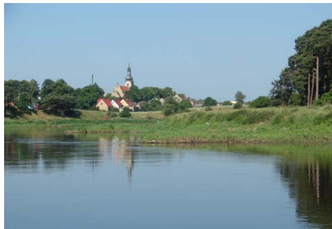
Het is steeds een mooi gezicht als er een nieuw dorpje opduikt.