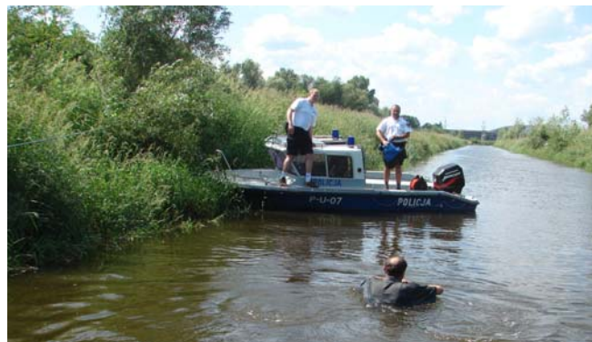
Vast in de oude arm van de Wisla. Er staat 1,20 meter water in het geultje. De doorgang bij de stuw was een betonnen plaat op 75 cm diepte zodat we hulp nodig hadden om er weer af te komen. 6 ton stopt niet in 1 keer...

Na kilometer 243 is er volgens Norbert een kanaaltje (oude Warta) dat naar een meertje voert waar je heel prettig kunt liggen. De ingang (9 uur 44) van het kanaaltje was ondiep, maar verder geen bezwaar. Een stukje verder ligt iets dat op een oude stuw lijkt. Ik vertrouw het niet en loop naar voren om te peilen. Te laat, we zitten al op het beton van de stuw. Het beton loopt door tot aan het achterschot.