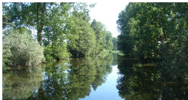
We naderen Pakosc.

Van het Pools zelf versta je toch zo goed als niets, zeker niet als het snel gesproken wordt. Maar verrassing: of het ook in het Nederlands mocht. Een van de heren had 3 jaar in Nederland gewerkt, bovendien had hij 2 zussen die in Nederland woonden. Nu werkte hij bij de brandweer in Barcin en er werd op de overkant van het water gewezen. Een poosje staan te praten, natuurlijk wilde hij weten waar we heen gingen enz. Kregen een ansichtkaart met stempel van de zeilvereniging mee. Als we nog eens langs kwamen ... . Kijkt die man naar onze zwaardklamp en ziet daar een munt van 2 Zloty op liggen. Nog van sluis 4! Hij pakte hem geroutineerd er af en ik kreeg hem weer terug. Natuurlijk heb ik hem toen ook verteld hoe die munt daar kwam. Het was goed voor een klein ijsje, vond hij. (We waren likkend aan een ijsje terug gekomen.)