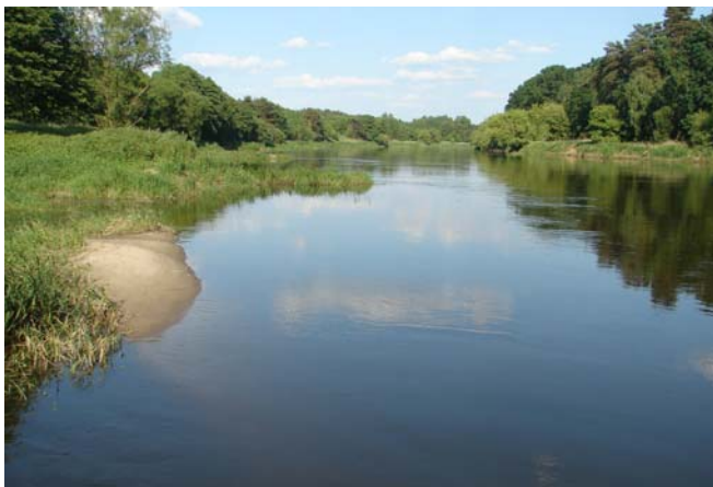
Ankerplaats bij Stopnicko vlak voor Obrzycko km 186.

zaten. Het werkte, de lijn heb ik op de voorbolder belegd, de jongens gingen trekken. En waarachtig, de zaak kwam in beweging. De jongens vonden het prachtig, gooiden de lijn te water toen we weer dreven en ik heb de lijn weer ingehaald en opgeruimd. Even verderop is de spoorbrug waar de vaargeul zo ongeveer via de wal loopt. Toen was het even voor 12.