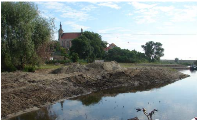
De jachthaven die in de gids staat. Er is 40 cm water in het bekken. Wij zijn maar gaan ankeren in zachte grond.

Toen wij het met z'n 2-en deden zette het nauwelijks zoden aan de dijk, maar nu met z'n 5-en was het wat anders. Een was er ondertussen lopend naar de wal gegaan (z'n korte broek is niet eens nat geworden) om te kijken of hij een boer zover kon krijgen te helpen met een tractor. Zoiets had Henk ook al geprobeerd, maar die was tot dezelfde conclusie gekomen als deze man: een tractor kan hier niet bij het water komen. Dus kwam hij weer terug en heeft geholpen om te schommelen. Dat zette wel zoden aan de dijk: met de talie konden we het schip nu wel achteruit trekken. Een paar keer de lijn inkorten, en toen dreven we weer. Lang leve de techniek! De jongens hebben onze lijn zelfs van de boom af gehaald en weer terug gebracht. Toen ik vroeg wat ze voor hun hulp wilden hebben kreeg ik het juiste antwoord: niets. Als watersporters onder elkaar help je elkaar. Dat hadden wij gisteren ook gedaan. Maar om 8 uur waren we dus weer los. We hebben heel voorzichtig de reis voortgezet, evengoed toch nog hier en daar de grond beroerd. Goed 9 uur waren we bij Pyzdry, volgens het boek zou daar een jachthaven zijn. Het boek bleek weer eens op de toekomst geschreven te zijn: men is er aan het baggeren en heeft stenen gestort voor wat de pieren voor de haven moeten worden. Ze zouden de rivier uit moeten baggeren, daar krijg je veel meer gasten mee. We hebben 2 ankers gezet, zijn de boel op gaan ruimen en toen naar bed.