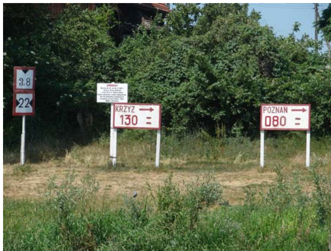
De waterstanden bij Kostrzyn.

Later op de ochtend trok die wind aan en kon je goed voelen dat hij gedraaid was ook. Hij komt nu uit het westen. Er stonden compleet kopjes op het water en er waren zelfs brekers. Wat wil je: wind tegen stroom. Is er verandering van weer op komst?