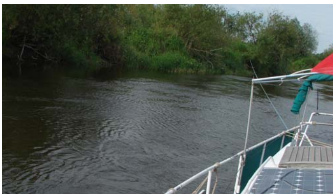
Km 368,2 vlak bij een zijriviertje lopen we zwaar op een richel met keien. Het voorschip ligt 20 cm droog.

Bij kilometer 361,2 kwam er van stuurboord een riviertje bij de Warta, we hebben hem niet gezien. We voeren keurig iets naast het midden in de buitenbocht. Wel merkten we vrijwel onmiddellijk daarna dat we met een grote knal op een richel stenen gevaren waren. We hadden nog een meter meer naar buiten moeten varen. Vallende spullen in de kajuit en een rare stand van het schip met z'n neus 15 cm omhoog. Dit was serieus: we zaten echt omhoog en muurvast. Henk is overboord gegaan in z'n zwembroek en heeft geprobeerd met een van de doften ons aan de voorkant los te wrikken. Het maakte niets uit.