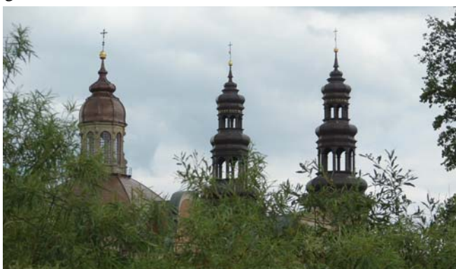
km 364,8 bij Ciazan

Om eerlijk te zijn, we hebben ongeveer 10x grondcontact (zand) gehad, een keer bij kilometer 367,5 over stenen. Het schip ging omhoog en scheef over stuurboord. Maar dank zij de zware motor en de dikke balk onder het schip gleden we er overheen.