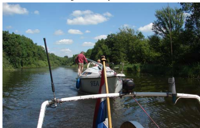
De Rea op sleep. Was met een peddel op weg naar Jez. Czame en moest nog 2 sluizen passeren.

11 uur, er drijft een zeilbootje (Rea) voor ons uit, ze hebben motorpech (of geen benzine meer) en meneer staat met een lijntje voorop. Of wij hem een sleepje konden geven? Natuurlijk wel, op het water help je elkaar, of je elkaar nu wel of niet verstaat. Maar toch lastig, we konden maar met moeite duidelijk maken hoe we de sleeplijn graag wilden hebben. We kregen een husseltje touw en moesten maar zien hoe we dat vast maakten. Uiteindelijk zat die lijn dan toch, maar voor ons gevoel is hij veel te kort.