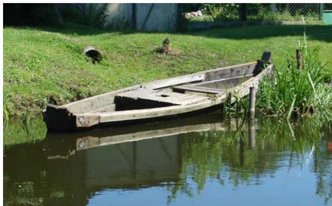
We naderen Pakosc.

Zodoende kwam het dat we om half 4 er eindelijk door waren. Het is maar goed dat dit de laatste sluis is die we in een hele tijd tegen zouden komen. We kregen echt het gevoel dat we nu toch maar wat vlotter door moeten varen, stel je voor dat het water bij Konin snel zou zakken.