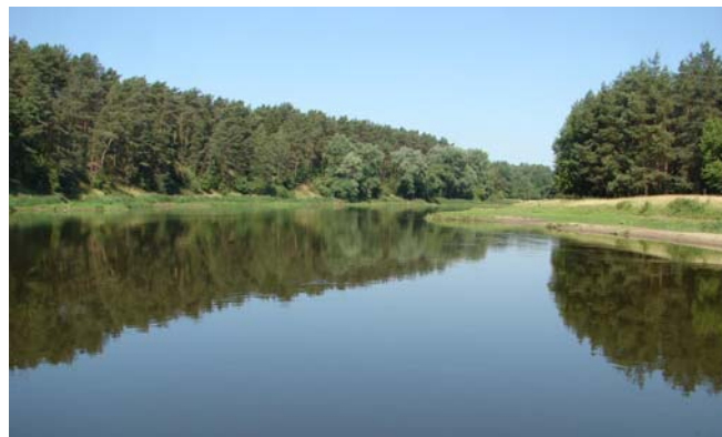
Spiegelglad water met de nodige grapjes.

Tegen half 6 vonden we het na dik 80 kilometer eigenlijk wel genoeg, we wilden best wel even zwemmen.