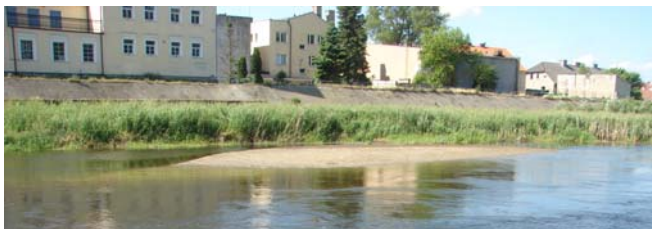
Konin. Zand lag er genoeg.

Hebben bedacht dat ze gewoon minder water hebben gehad. Zij waren daar omgekeerd en terug gegaan naar de sluis om het hele Apenkanaal weer te gaan varen. Bij Konin zou even gestopt kunnen worden, maar het ging zo goed dat we door zijn gevaren. Volgens de sluiswachter viel het water nogal snel door de vele weken van mooi weer. Dan maar doorvaren en zorgen dat we bij Posnan komen. Bij een van de voorsteden van Konin lag een veerpont die met tonnetjes over de Warta gierde. Zonder problemen ook daar langs.