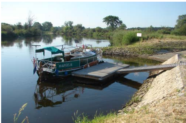
Onze gedoogde ligplaats bij Goslina