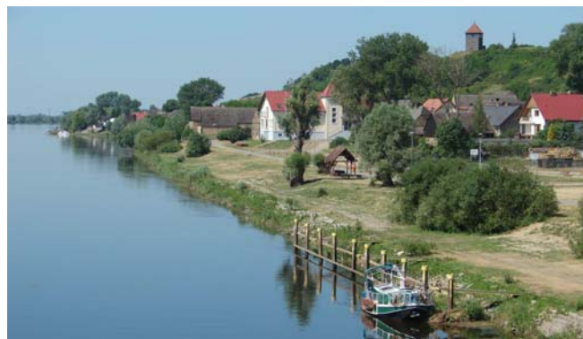
14 dagen geleden was alles nog groen.

We zijn vandaag ongeveer 30 meter in hoogte naar beneden gekomen.