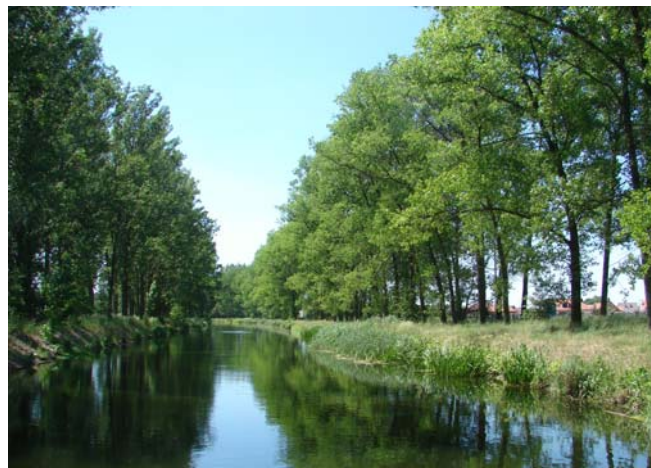
Het Apenkanaal. (kanal Gornonotecki)