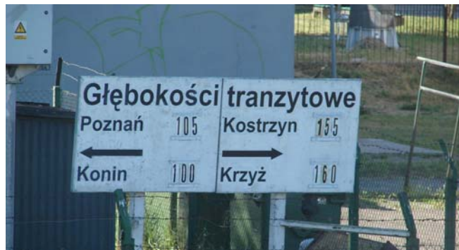
Een optimistisch beeld van de waterstand die niet klopt met de weergave in Posnan en Kostrzyn.

Even voor 5 uur kwam er een tegenligger aan. Het bleek een Duits jachtje te zijn, de Egon. Volgens Henk hebben we dat jachtje vorig jaar in het Spreewald ontmoet. Hij had het toen er over ook nog wel eens naar Polen en Posnan te willen gaan. Nu moest het er kennelijk van komen, maar ik weet niet of dat wel een erg goed idee was. Het bootje is van multiplex, als die op de stenen loopt gaat hij aan flinters. En we hebben in de praktijk ervaren dat het helemaal geen kunst is om op de stenen terecht te komen.