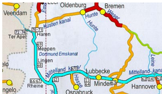
Kaartje Reispost nummer 8 Van Hannover naar Ter Apel.