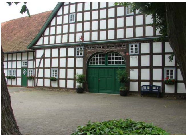
Een huis in Harpenfeld

Dan op zoek naar het volgende huis: slot Ippenburg. Er stonden hier een aantal reisbussen, dus we namen aan dat er hier wel iets te beleven zou zijn. Bij de toegangspoort stond een soort kassa-gebouwtje, we hebben daar wat informatie gevraagd. Op het binnenplein stond een grote groep wat oudere mensen. Het bleek dat dit huis ook privé bezit is, je komt er niet echt in. Door de week laten ze groepen op het terrein (na afspraak en onder geleide van een gids), op zondag mag de loslopende bezoeker er rond dwalen. Ook hier is een soort café bij, maar volgens de gidsen was dat ook alleen maar voor de groepen. Maar, we zouden kunnen proberen. Dus zijn we het café binnen gestapt en hebben bij de (dure) bediening geïnformeerd wat de mogelijkheden zouden zijn. Het meisje dat we aanspraken zou even vragen, dus wij wachten. Ze kwam weer terug en bracht ons naar een tafel. Of we koffie zouden kunnen krijgen en evt. iets er bij? Ze kwam terug met koffie en thee en vertelde dat er nog appelkoek was. Nou, dat leek ons wel, dus dat graag. Toen ze met het appelgebak terug kwam wilde ze graag gelijk afrekenen, en dat leek me een heel verstandig idee. Tenslotte waren we min of meer als ongenode gasten daar, we wilden dus zo weinig mogelijk last veroorzaken. De koffie, thee en het appelgebak waren prima, dus toen we weer weg gingen hebben we het meisje op een afstandje heel hartelijk bedankt. Ze vond dat heel aardig zo te zien.