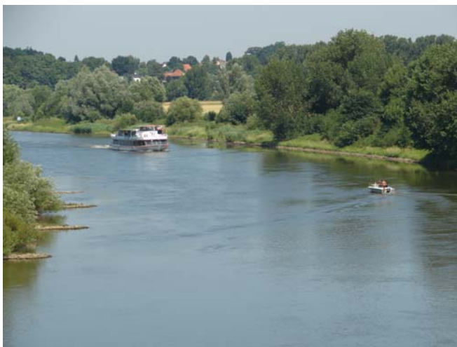
Blik op de Weser vanuit het aquaduct.