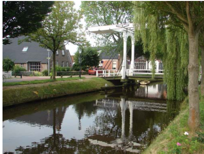
De Pekel Aa.

Toen we naar bed gingen was het vóór nog 27 graden.