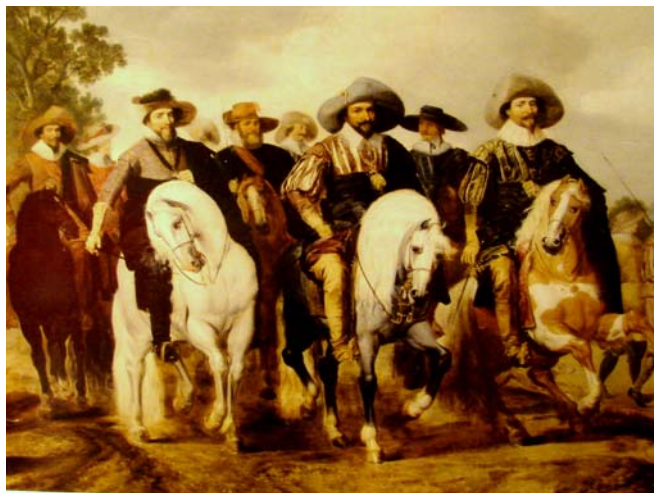
De 3 zoons van Willem van Oranje.

Het plekje waar koffie of thee kon worden gedronken was niet bezet, dus dat ging over. Dan maar weer naar de overkant. Uitgebreid verhalen gehoord over het gieten van klokken, wij hadden al wat "voorwerk" gedaan door het lezen over klokken en klokkenstoelen. Nu wisten we dus al het een en ander en dat scheelde een stuk. In onze informatie over het Klokkemuseum stond dat er voor groepen een rondleiding was, maar wij hebben (door ons enthousiasme en al het een en ander weten) een privé rondleiding gekregen. We konden vooral bij het gedeelte over de torenuurwerken een hoop aan onze rondleider vertellen, ook een hoop aan de opgestelde uurwerken laten zien. Hij heeft een hoop geleerd vanmorgen.