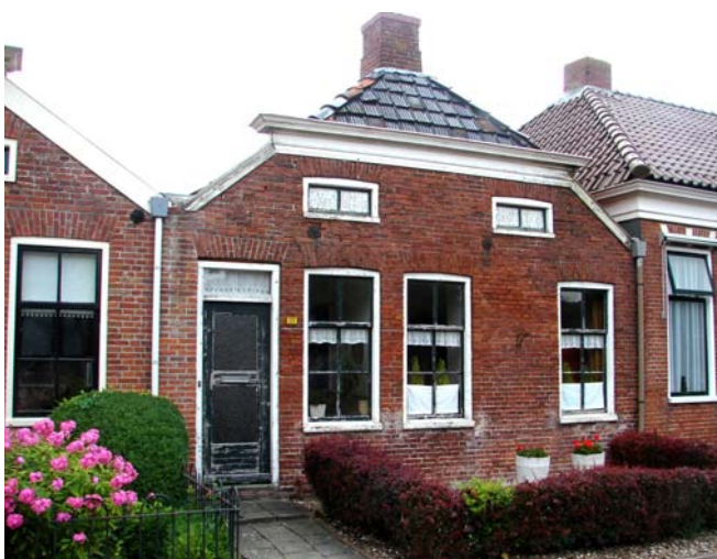
Huisje in Oudeschans.

Of de wind was anders, andere richting of minder hard, de varkens stonken niet meer zo geweldig. Het sluisje was een "eitje", het was knop drukken, kettinkje trekken, klaar. Ik stond al klaar met de sleutel, maar die was nergens voor nodig. Het Winschoterdiep was niet veel anders dan de Westerwoldse Aa, misschien iets breder maar ook hier waren de wallekanten lang niet overal bevestigd. De spoorbrug was eerst wachten, er moest nog een trein komen. Pas om 2 uur zou hij weer kunnen draaien. Helemaal niet erg, we waren er pas om half 2 dus zo lang hoefden we niet te wachten. Er lag al een scheepje te wachten: het scheepje dat ook in Nieuwe Schans aan de steiger lag. Het bedienen van de spoorbrug werd door een treinman gedaan, hij had alleen geen kijk op varen. Er kwam n.l. van de andere kant ook nog een bootje aan, die had het voor de wind.