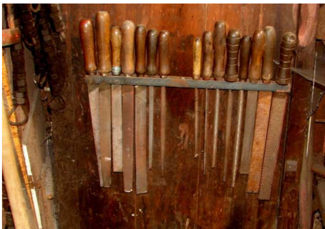
Vijlenrekje naast de werkbank van de smid.

Bij de smid weer vandaan zagen we langs de kant een zelfbouw camper staan, een oud Peugeot busje. Ook daar even een praatje gemaakt. Die mensen wisten niet eens het bestaan van Oude Schans, ze waren er al zwerfend "per ongeluk" gekomen. Zij waren van plan om nog even tot na de middag te wachten, dan zou er wel het een en ander open zijn was hun verteld. Wij zijn terug gereden naar de boot, de wolken werden hoe langer hoe dreigender. Terug aan boord ging het inderdaad regenen. Maar toen hadden we de fietsen al weer aan boord, dus was het niet zo'n punt meer. Even dit stukje bij geschreven, eten en dan weer verder. Terug naar de varkenshouderij en de sluis.