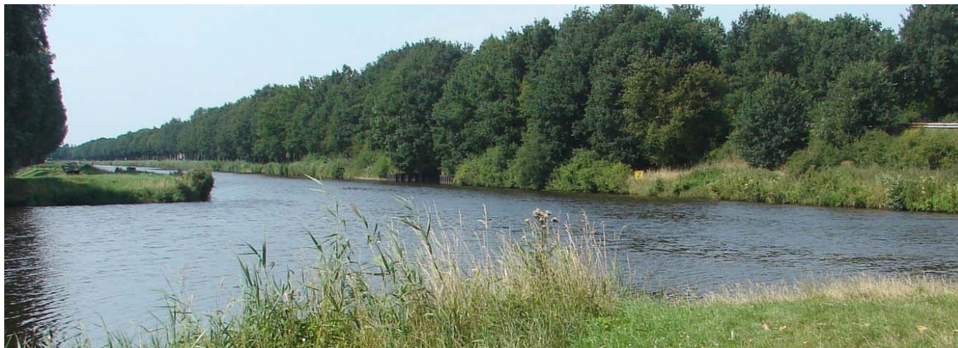
Het Winschoterdiep bij km 30.

bedwang te houden met een flinke bries achter. Uiteindelijk werd er gereageerd op een telefoontje van Henk. Het zou nog een kwartiertje duren. Toen hebben we maar besloten om langs de wal te gaan om te wachten.