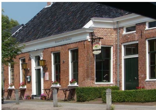
Restaurant 'Het Sluishuis' bij de middenluis.

Hij vertelde toen we Veendam in kwamen dat de boxen in de gemeentelijke haven heel klein waren, maar toen we er tegen half 5 kwamen (er mag onderweg niet overnacht worden) viel het mee. Kennelijk is de haven vernieuwd, de boxen zijn vergroot. We steken nu nog maar ongeveer 1,5 meter uit. Vanavond maar het roer dwars zetten, dan zijn we nog iets korter. Morgen blijven we hier, we willen naar het scheepvaartmuseum en dat is pas in de middag open. Eigenlijk hadden we met het museumtreintje naar Stadskanaal willen gaan maar die gaat pas op zondag weer. Dus of we daar heen gaan?