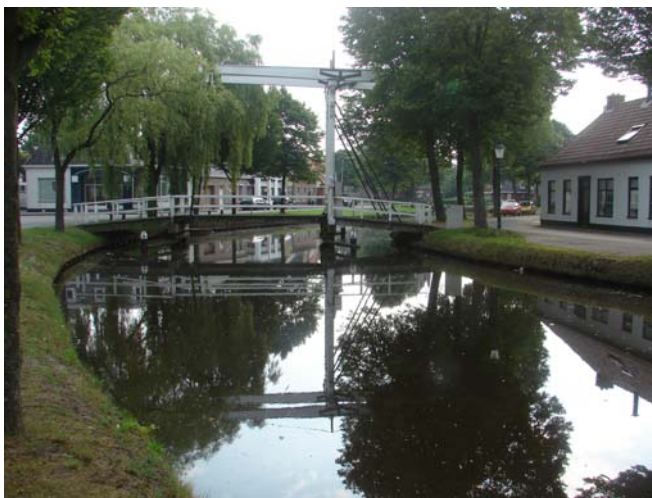
Hier is duidelijk te zien dat de Pekel Aa een riviertje is.