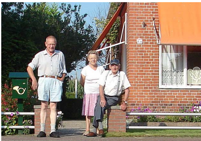
De konvooien zijn nog een bezienswaardigheid. De route is pas sinds 1 mei open.

Gelukkig was alles wat onder de vloer stond afgesloten en het alarm waarschuwde luid en duidelijk zodra er een klein beetje water op de vloer kwam. Maar vervelend was het wel. De eerste de beste keer dat ik boven aan de lijnen zat ging ook dat weer fout en kudelde ik bijna over boord.... Zoals ik al schreef "een dag met een gaatje".